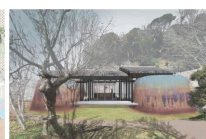
《ハニヤスの家》 榎永絵理子