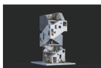
《二重らせんのビル》 大島碧+小松大祐

[展覧会]会場 グランフロント大阪 うめきたシップ 2F うめきたシップホール 〒530-0011 大阪市北区大深町4-1