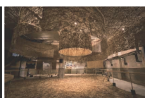
《Poesis-3つの素材と技術-》 大野宏