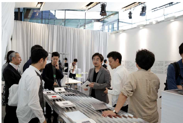
2015年度の展覧会会場風景